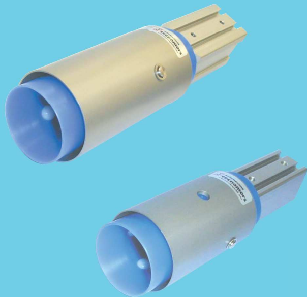
Organi di presa per bottiglie • Bottle grippers